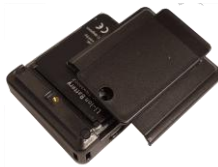
Device Cover with Clip