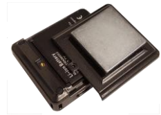
Device Cover with Magnet

We are here to help. Questions? Call 1-800-941-4200 Monday through Friday from 8am until 5pm EST